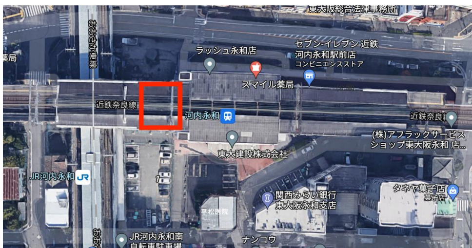
出店場所 近鉄河内永和駅高架下