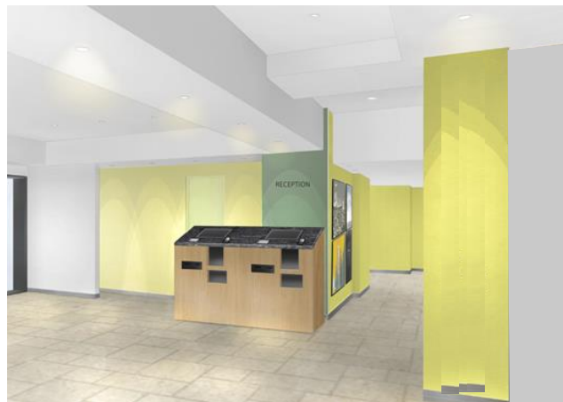
【1階ロビー 自動チェックイン機（イメージ）】

自動チェックイン機を導入することで、スタッフと非対面でチェックイン・チェックアウトが可能です。