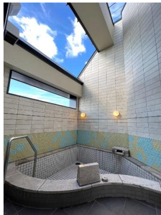
【露天風呂（イメージ）】