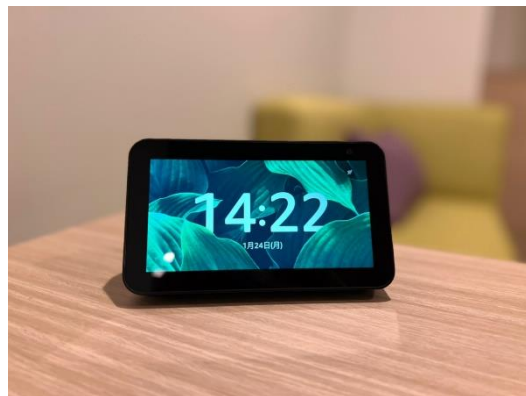
【スマートスピーカー】

癒し・安らぎを感じていただけるようなグリーンをカラーコンセプトとした部屋になっています。また、客室の窓には完全遮光のロールスクリーンを採用しており、質の高い眠りをお届けいたします。