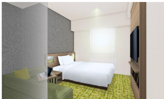
【客室 ダブルルーム（イメージ）】